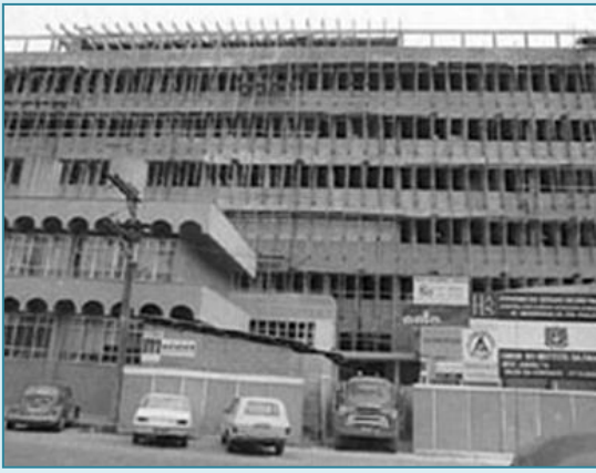
Instituto da Criança em construção (1973)